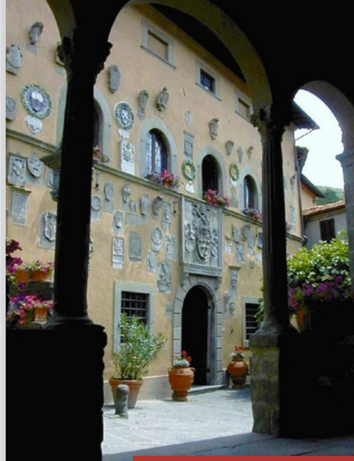
Uno scorcio del Palazzo dei Capitani

La chiesa della Madonna di Piazza risale al secolo XV e si presenta ad una sola navata: sul suo altare maggiore è collocata una robbiana raffigurante la Madonna col Bambino e i santi Antonio Abate e Bernardino da Siena , attribuita a Benedetto Buglioni e databile al 1510 circa.