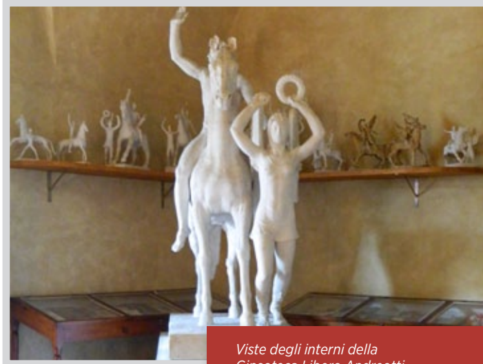
Viste degli interni della Gipsoteca Libero Andreotti

Gli ultimi anni della sua vita li trascorse a Firenze, dove fu animatore dell'ambiente culturale cittadino. È sepolto nel cimitero delle Porte Sante di San Miniato al Monte in Firenze.