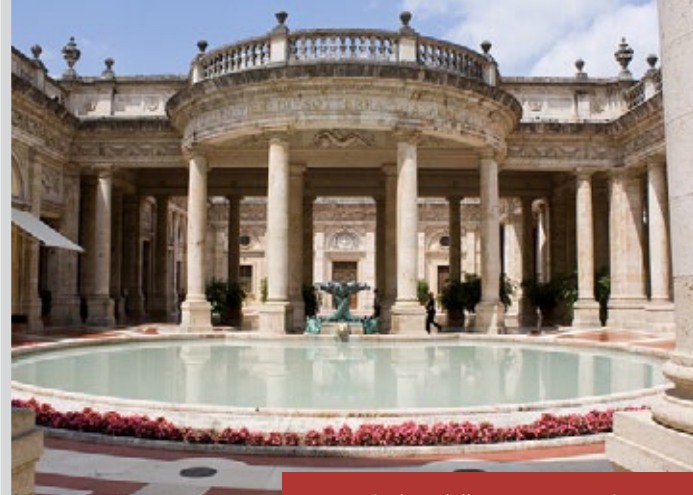
Un particolare delle terme Tettuccio

la facciata originaria all'interno dello Stabilimento. Il Tettuccio rappresenta una vera città termale con parchi, caffè, concerto e negozi. Interessanti sono le decorazioni dei vari padiglioni che arricchiscono la sontuosità dello stabilimento, dalle ceramiche della Galleria delle Bibite di Basilio Cascella, agli affreschi di Giuseppe Moroni nella sala di scrittura e di Giulio Bargellini e Maria Biseo nel salone del Caffè, fino alle decorazioni di Ezio Giovannozzi nella cupola della tribuna dell'orchestra, coperta con tegole a squame in maiolica della Manifattura Chini. A lato della Sorgente Tettuccio, Giovannozzi ristrutturò lo Stabilimento Regina. Di fronte a questo troviamo la fontana di Raffaello Romanelli del 1925 con il soggetto dell'airone e la rana, simbolo di Montecatini Terme. Non lontano dallo Stabilimento Tettuccio, sempre all'interno del parco cittadino, è possibile visitare le Terme Tamerici, ristrutturate nel 1910 da Giulio Bernardini e Ugo Giusti oggi sede del "Circolo Culturale Tamerici". Galileo Chini realizzò all'interno i pannelli, i banconi, le vetrate e i pavimenti della vecchia sala di mesquita. La visita si può concludere con il "Grand Hotel & La Pace" costruito nella seconda metà dell'800 e più volte trasformato. Nel 1904 venne inaugurato il salone delle Feste affrescato dal Chini autore anche dei disegni per le vetrate della vecchia hall.