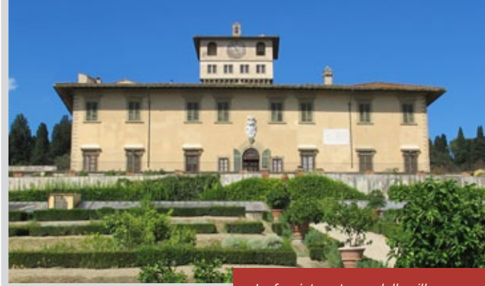
La facciata esterna della villa

stra della villa, la fontana del Tribolo, che aveva a coronamento la statua del Giambologna raffigurante Fiorenza in atto di spremersi i capelli dalle acque dell'Arno e del Mugnone . L'originale di questa scultura è attualmente collocato all'interno della villa. Durante il periodo napoleonico il parco fu aperto al pubblico (1805) e fu dato un nuovo assetto al giardino. Purtroppo, in questo periodo scomparve tutta la mobilia, venduta nel 1799. Soltanto i quadri furono salvati perché trasferiti in altre sedi. Il grande viale fra Castello e la Petraia si deve all'iniziativa di Leopoldo II di Lorena. Dopo l'annessione della Toscana al Regno d'Italia, la villa fu tra i beni che pervennero ai Savoia, insieme a Palazzo Pitti e a molti altri palazzi e ville. All'epoca di Firenze capitale, la Petraia divenne la residenza 'privata' del re Vittorio Emanuele II, che si era insediato a Palazzo Pitti, nuova sede ufficiale dei sovrani.