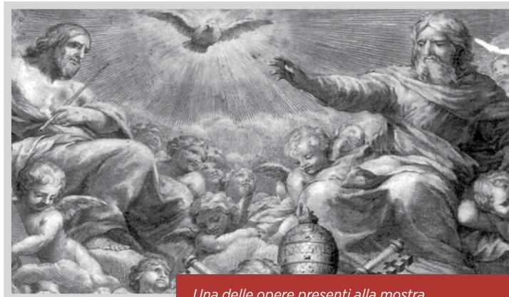
Una delle opere presenti alla mostra “Introibo ad altare Dei”