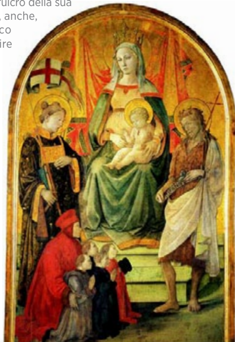
Filippo Lippi, Madonna col Bambino tra i santi Stefano e Giovanni Battista; Francesco Datini e i committenti (Madonna del Ceppo)

sono gli apparati di comunicazione, grazie agli strumenti multimediali e a due suggestive videoproiezioni: sulla storia del Palazzo e sulla Sacra Cintola , la reliquia simbolo della città, con la ricostruzione virtuale degli splendidi affreschi di Agnolo Gaddi in Duomo. Accanto ai dipinti e alle sculture patrimonio della città, il Pretorio ospiterà altre mostre, grazie alla rete di collaborazioni intrecciata con Musei di primaria importanza. Palazzo Pretorio torna così ad essere lo scrigno dei tesori della città, il fulcro della sua vita culturale, ma, anche, il luogo magnifico nel quale costruire per Prato la forza di una nuova speranza.