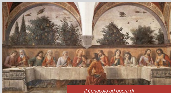
Il Cenacolo ad opera di Domenico Ghirlandaio (1480)

All'ex refettorio del Convento di Ognissanti, adiacente alla chiesa, dà grande lustro l'affresco realizzato nel 1488 da Domenico Ghirlandaio. Il soggetto dell'Ultima cena, tipico dei refettori fiorentini dal Quattrocento in poi, fu concepito all'interno di una loggia, alle cui spalle un giardino rigoglioso di alberi e simboli cristiani come le arance, la palma del martirio, i cipressi e diverse specie di uccelli, danno l'occasione per cogliere riferimenti al Paradiso terrestre, alla Morte e alla Resurrezione, argomenti già anticipati nella scena protagonista del sacro pasto.