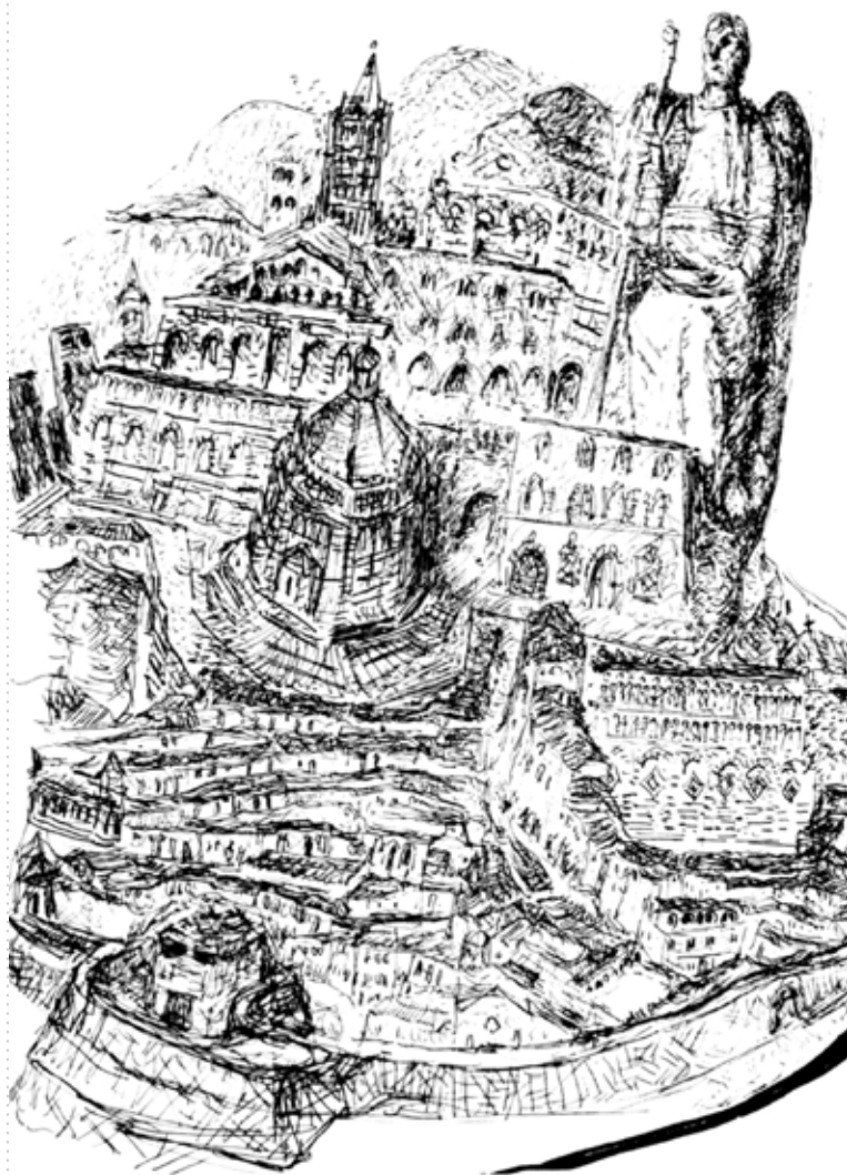
Egle Marini Composizione fantastica con monumenti di Pistoia