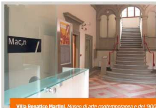
Villa Renatico Martini, Museo di arte contemporanea e del '900

Per il calendario e tutti i dettagli delle visite guidate di “Incontri... d’Arte” 2018 visita il sito della Fondazione: