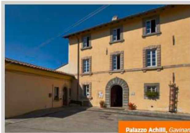
Palazzo Achilli, Gavinana