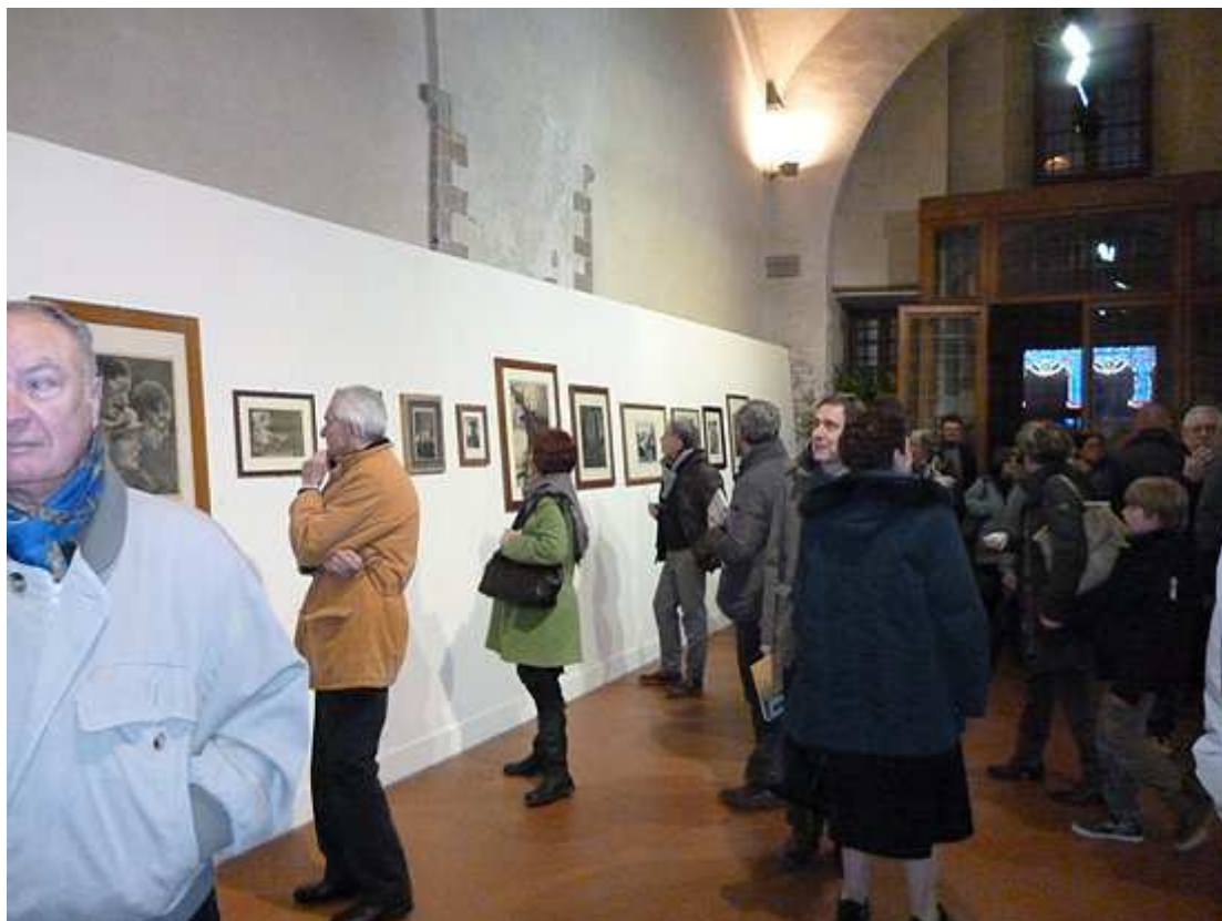
La mostra "Pistoia. L'anima del luogo. A 100 anni dalla mostra del Bianco e del Nero", presentata nel 2013 in occasione dell'uscita del settimo volume di "Spicchi di Storia".

I curatori della mostra, che con intelligenza critica e sensibilità, hanno reso possibile l'iniziativa, sono gli stessi autori del volume, studiosi noti e apprezzati per la competenza e passione con cui da anni si occupano di tematiche diverse, attinenti alla storia dell'arte del Novecento pistoiese.