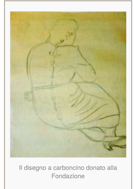
Il disegno a carboncino donato alla Fondazione

L'opera donata alla Fondazione – un disegno a carboncino presumibilmente degli anni Cinquanta raffigurante una donna ritratta di schiena – entrerà a far parte del patrimonio della Fondazione e in linea con le finalità dell'ente, che fin dalla sua istituzione sostiene la tutela e la valorizzazione dei beni artistici del territorio, sarà messa a disposizione della cittadinanza per mostre, pubblicazioni, ricerche ed altre iniziative pubbliche, di natura culturale.