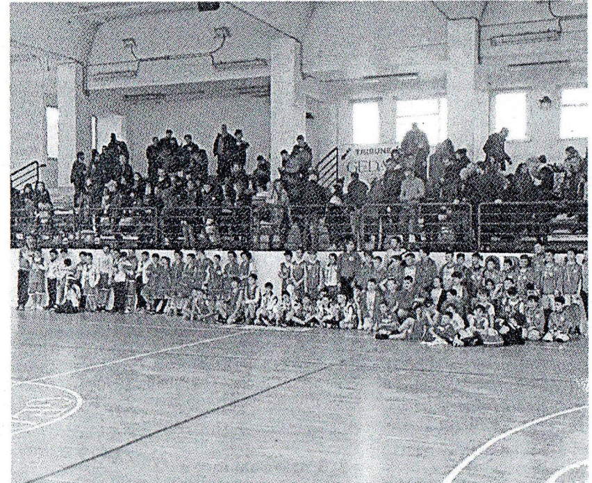
Girone all'italiana per la sfida tra gli Aquilotti