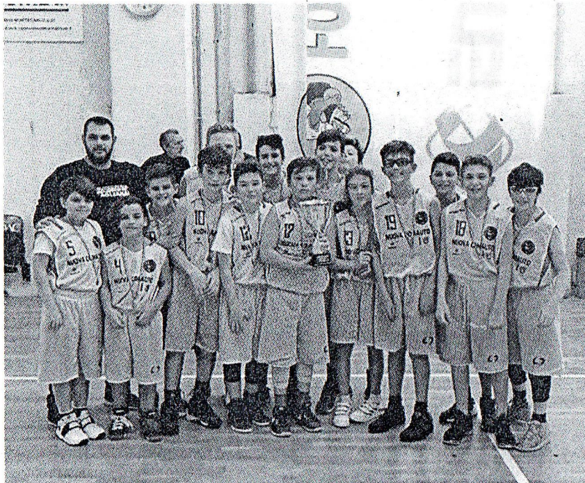
La squadra della Nuova Comauto Agliana under 13, che ha battuto Bottegone in finale