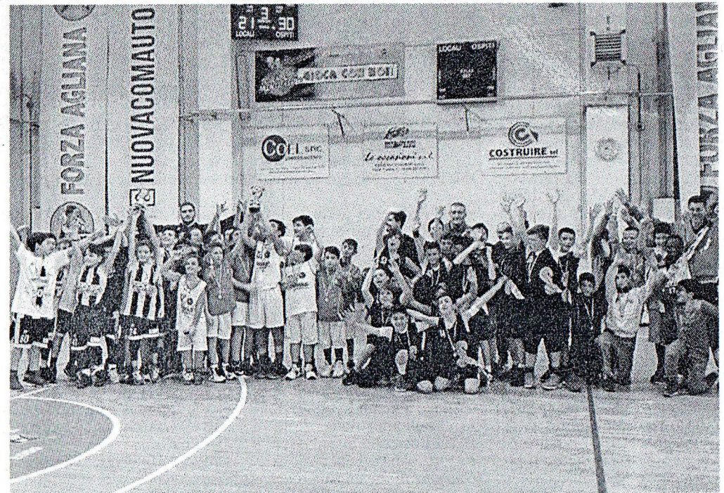
Tra gli Esordienti ha trionfato la squadra di Prato che ha sconfitto in finale Agliana